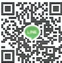
กลุ่มหลักสูตร Actice Teacher

ประธานสมาพันธ์แพลตฟอร์มการศึกษาและอาชีพแห่งประเทศไทย