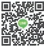
กลุ่มหลักสูตร THE CXO ๒๐๒๓

ประธานสมาพันธ์แพลตฟอร์มการศึกษาและอาชีพแห่งประเทศไทย