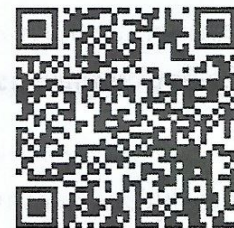
ใบสมัครและเอกสารโครงการ