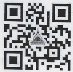
ส่งหลักฐานการชำระเงิน

สำนักงานเลขานุการ คณะนิติศาสตร์ โทรศัพท์ ๐๔๕-๓๕๓-๙๓๐ อีเมลล์ : academic.s@ubu.ac.th