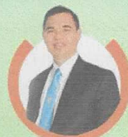
ว่าที่ร้อยตรี ดร.ชญ วังจินดา เลขาธิการคณะกรรมการการศึกษาขั้นพื้นฐาน รักษาการประธาน