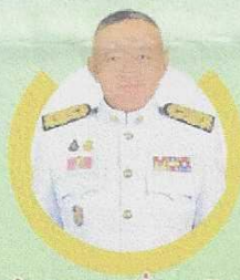
พลตำรวจเอก เพิ่มพูน ชิดชอบ รัฐมนตรีว่าการกระทรวงศึกษาธิการ ประธานพิธีเปิด บรรยายพิเศษและมอบโล่ขอบคุณดีเด่น

วันที่ 25 - 28 เมษายน 2567 ณ โรงแรมเชียงใหม่ภูคำ จังหวัดเชียงใหม่