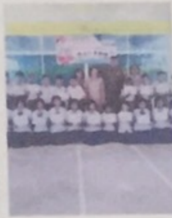
ภาพที่ 1 ประมวลภาพกิจกรรมโครงการสถานศึกษาสีขาวปลอดยาเสพติดและอบายมุข